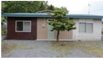
一般戸建住宅 (有珠郡壮瞥町洞爺湖温泉53)